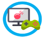
TV a konzole

TV a konzole – Nové televize jsou již také „smart“, chytré. Stejně jako mobily. Kdejaká TV či konzole jde hacknout (nabourat, napíchnout) a může třeba odposlouchávat , co doma říkáte. Není to žádná sci-fi, když jsou taková zařízení připojená na internet. Takže zabezpečit domácí wifi a používat hlavu, se i v tomto případě může bohatě vyplatit.