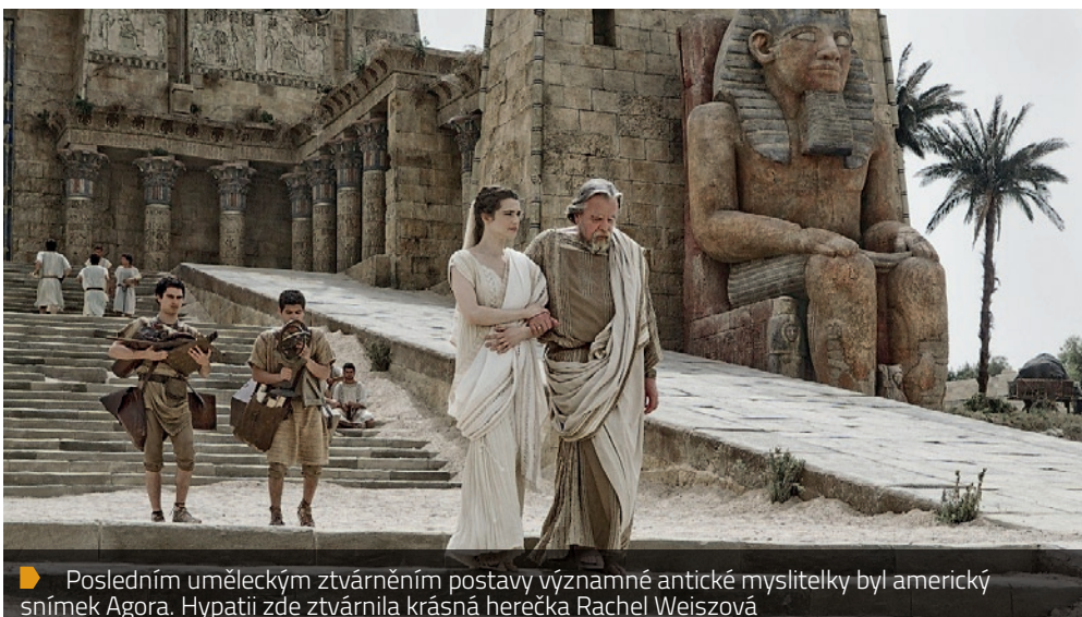
► Posledním uměleckým ztvárněním postavy významné antické myslitelky byl americký snímek Agora . Hypatii zde ztvárnila krásná herečka Rachel Weiszová