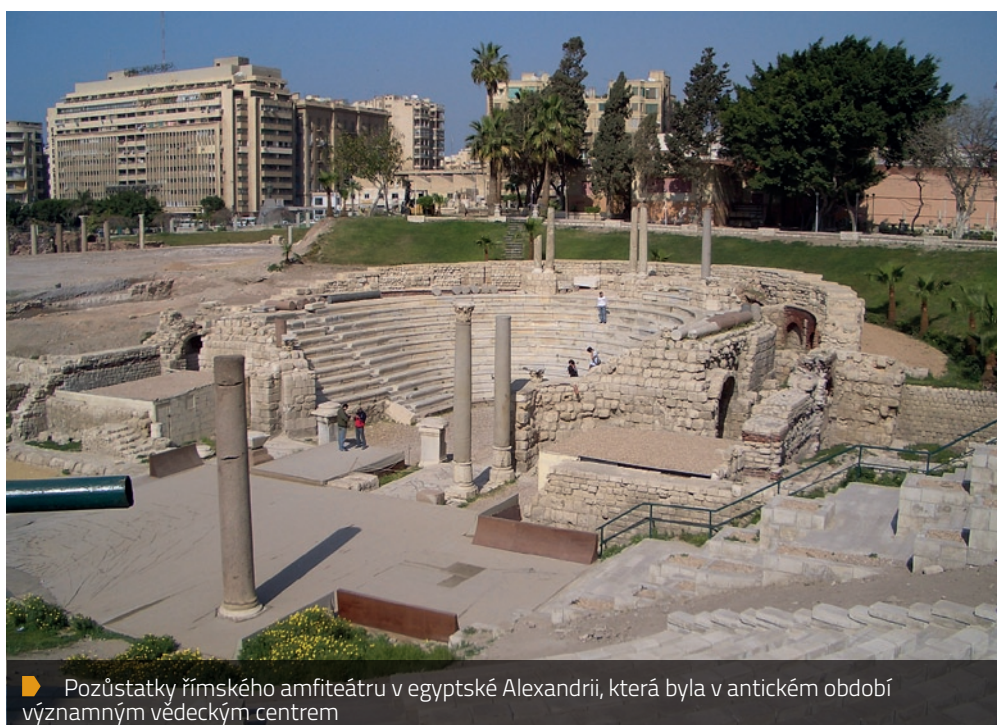
► Pozůstatky římského amfiteátru v egyptské Alexandrii, která byla v antickém období významným vědeckým centrem

V posledních dvou staletích bylo jméno antické myslitelky opakovaně zmiňováno v literatuře a textech mnoha rozdílných žánrů. K Hypatii se hlásili četní romanopisci, feministky, autoři sci-fi literatury i malíři a filmaři. Typické je, že na obrazech a ve filmech bývá často zobrazována jako mladá žena nebo přímo atraktivní dívka. Ve skutečnosti jí v době smrti muselo být nejméně 45, možná dokonce 65 let. Na poměry dané doby už tedy musela být stařenou. V obdivuhodné míře se k Hypatii hlásili a hlásí také astronomové, pokládající alexandrijskou vědkyni za jednoho ze svých předchůdců. Například v roce 1884 tak byl podle ní pojmenován nově objevený pás asteroidů 238 Hypatia, její jméno nese také jeden měsíční kráter. Jméno Hypatia se již dostalo rovněž do oblasti informačních technologií a softwaru, entomologie (v podobě latinského názvu jednoho druhu hmyzu) a názvů různých učených společností a kroužků v západním světě. Nejnověji byla postava pohanské vědkyně a filozofky zpopularizována filmem Agora , kde Hypatii ztvárnila herečka Rachel Weiszová. Přestože původní obraz ženy, žijící před dlouhými šestnácti staletími, se v průběhu doby již značně pozměnil, její učení a síla osobnosti k nám výmluvně promlouvá i dnes. ◀