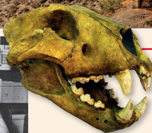
Lebka jeskynního lva Panthera spelaea . Naši předci se s touto kočkou zřejmě často potkávali, jak dokazují nálezy jeskynních maleb

Dále to byli medvědi jeskynní, mohutní příbuzní dnešních medvědů hnědých.