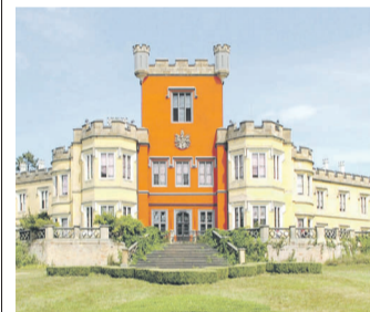
U nás doma

Strana U nás doma vzniká díky vám, našim čtenářům. Píšíte nám o věcech, které vám udělaly radost, sledujete, co se u vás děje, posíláte nám perličky ze života i pozvání na výlet. Fotoaparát zachycuje zajímavosti i dění kolem vás. Pokud jste viděli nebo zažili něco zajímavého, poučného, veselého, neobvyklého, nenechávejte si to pro sebe a dejte nám vědět. Fotíte? Pak neváhejte a podělte se o své foto „úlovky“ s námi: drahomira.povazanova@denik.cz