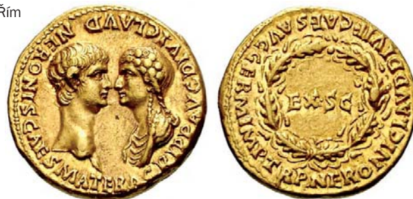
Zlatý aureus s podobiznou Nerona a jeho matky Agrippiny, zřejmě rok 54 n. l.

Císaři zřejmě v očích současníků uškodila jeho výrazná stavební aktivita po požáru, jejímž výsledkem byl i jeho ohromný palácový kom- plex Domus Aurea („Zlatý dům“). Tyto okolnosti byly interpretovány tak, že Nero potřeboval zís- kat pozemky bohatých Římanů pro svůj palác a využil k tomu záměrně založeného požáru.