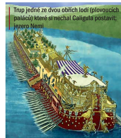
Trup jedné ze dvou obřích lodí (plovoucích paláců) které si nechal Caligula postavit; jezero Nemi

Ani dnes nevíme přesně, jaká nemoc byla příčinou Caligulova úpadku. Některé zdroje uvádějí, že císař zřejmě prodělal encefalitidu. Tak by alespoň bylo možné interpretovat starověké zdroje, jakými jsou například Suetonius nebo Cassius Dio, kteří napsali, že Caligula prodělal „mozkovou horečku“. Dle jiných odhadů mělo jít pouze o nervový kolaps, způsobený tím, že Caligula nebyl zvyklý na stálou a neodbytnou pozornost.