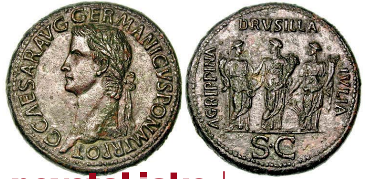
Římský sestercius z roku 38 n. l. s podobiznou Caliguly na líci. Na zadní straně jsou znázorněny jeho tři sestry, se kterými údajně udržoval incestní vztah

již v pokročilé fázi své psychické choroby rozhodl, že ze svého milovaného hřebce Incitata udělá římského senátora. Nevíme, zda něco takového opravdu přinesl. Pokud však ano, mohlo jít o pouhý politicky zabarvený výrok, kterým vyjádřil nespokojenost nad prací a schopnostmi senátorů. Jinými slovy vlastně podotkl, že jeho kůň je kvalifikovaný pro práci stejně dobře, jako leckterý senátor či úředník. Jiné pikantní historky jsou již závažnější. Patří k nim vyprávění o neskrývaném incestu s jeho