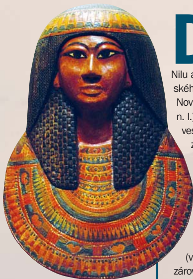
Pohřební maska Sennedžemova syna Chonsua nalezená v malířově hrobce