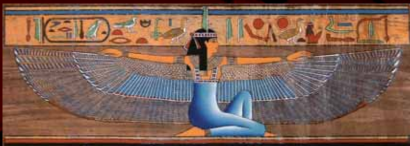
Bohyně spravedlnosti Maat s roztaženými křídly

V soudních sporech byla často využívána věštiny . Prostřednictvím orákula byl bůh, představovaný skupinou kněží, zahmován otázkami typu „ano nebo ne?“ ohledně závažných rozhodnutí a při posuzování viny či nevinou souzených.