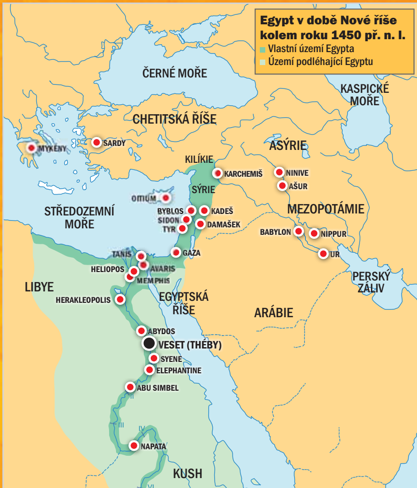
Egypt v době Nové říše kolem roku 1450 př. n. l. ■ Vlastní území Egypta ■ Území podléhající Egyptu

Ahmoše dokázal Hyksósy, ovládající nilskou deltu, vypudit důmyslnou reorganizací armády. Egyptské vojsko bylo vybaveno kvalitnějšími zbraněmi, mezi nimi hyksóskými luky, válečnými vozy a bronzovými meči. U vyhánění vetřelců se však nový faraon nezastavil