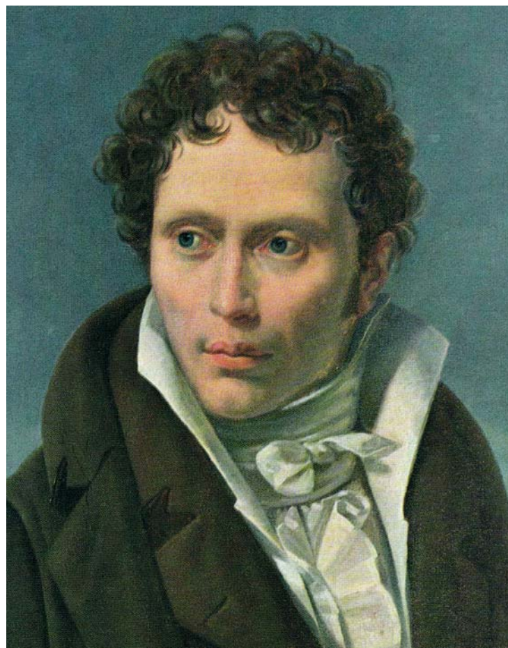
♦ Mladý Arthur Schopenhauer na portrétu od malíře L. S. Ruhla, 1815

♦ Rodný dům Arthura Schopenhauera na ulici Heiligeistgasse v polském Gdaňsku