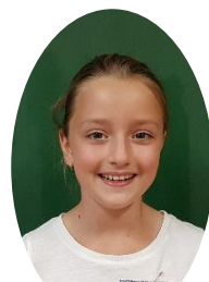
Závin pekla Maki

Náplň: 4 nastrohaná jablka na plátky vlašské ořechy třtinový cukr skořice moučkový cukr na posypání