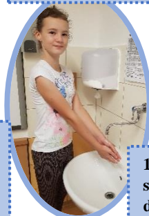
9. Opláchni ruce vodou.