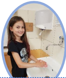
3. Tři ruce dlaněmi k sobě.