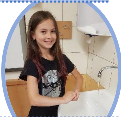
6. Prsty zaklesni, hřbet prstů tři o dlaň druhé ruky.