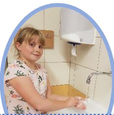
8. Všech pět prstů pravé ruky dej k sobě a rotačními pohyby je tři o levou dlaň (a naopak).