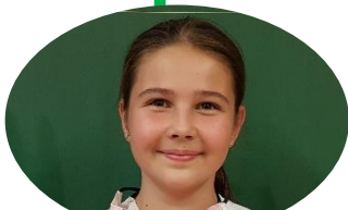
Bábovku pekla Kája

Oloupaná jablka nastrohujte. Žloutky vyšlehejte s máslem a cukrem do pěny a přidejte prosetou mouku a prášek do pečiva. Dále přidejte mléko a tvaroh. Z bílků ušlehejte sníh, který osolte a postupně ho přimíchejte společně s jablky ke směsi. Směs vlijte do bábovkové formy vymazané máslem a vysypané moukou a pečte cca. 45 minut na 170°C.