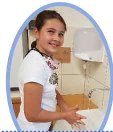
5. Tři dlaně o sebe, s propletenými prsty.