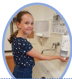
2. Vytlač dostatek mýdla.