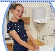
7. Levý palec tři celou sevřenou dlaní pravé ruky, poté pravý palec stejně levou dlaní.