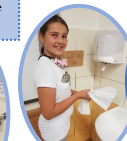
10. Zastav vodu, aniž by ses dotkl kohoutku a důkladně ruce usuš.