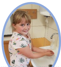
1. Ruce navlhčí.