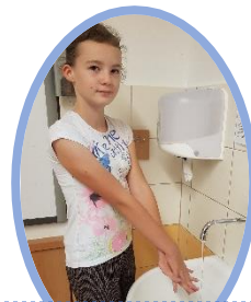
4. Pravá ruka otírá hřbet levé ruky s propletenými prsty (a naopak).